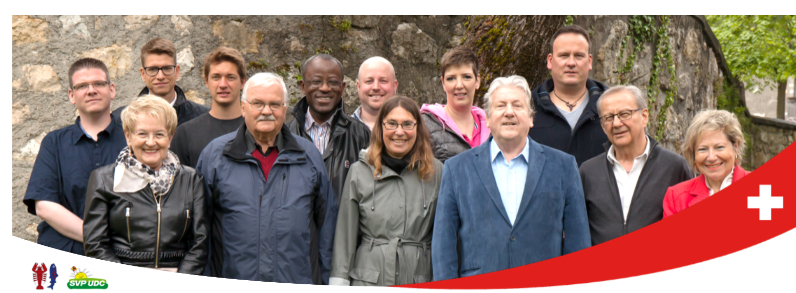
Kandidaten der SVP Nidau für die Nidauer Wahlen vom 24. September 2017