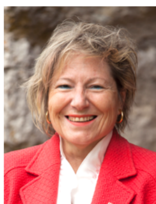
Kand. Nr. 2.13

SVP - mit sicherer Hand für Nidau! Wir sprechen an, was die Menschen bewegt. Das ist unsere Leitlinie für die kommenden Jahre.