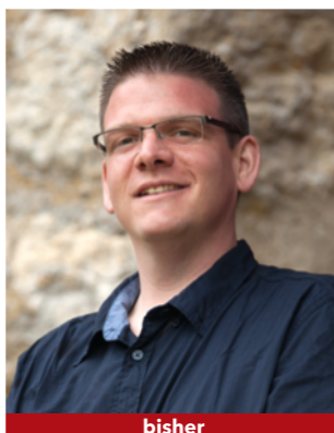
bisher Kand. Nr. 2.03

Mir habe sorg zu Nidau! Zusammen gegen die Zubetonierung durch AGGLOlac und für mehr Wohn- und Lebensqualität in ganz Nidau!