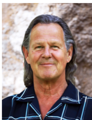
Kand. Nr. 2.06

Ich möchte mithelfen, dass unser schönes Städtchen Nidau lebenswert und sicher bleibt.