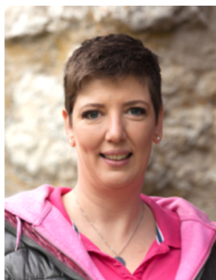
Kand. Nr. 2.08

Als zweifacher Familienvater setze ich mich für mehr Sicherheit, für sinnvoll geplanten Schulraum und für gesunde Finanzen ein - Für ein attraktives Nidau!