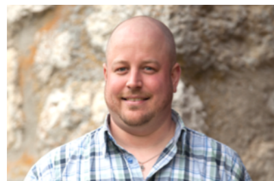
Kand. Nr. 2.02

1955 Dipl. Betriebsfachmann HF Gemeinderat, Ressort Soziales, bisher www.rolandlutz.info