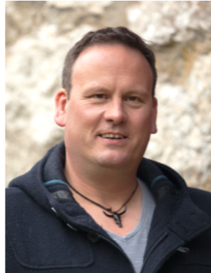
Kand. Nr. 2.09

Ich möchte mithelfen, unser Nidau weiter zu entwickeln.