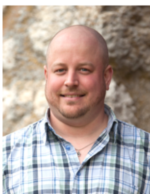
Kand. Nr. 2.07

Ich möchte mithelfen, dass in Nidau sachpolitisch gehandelt und gearbeitet wird.