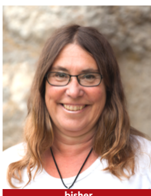
bisher Kand. Nr. 2.05

Für innovative und moderne Ideen, die zu Nidau passen!