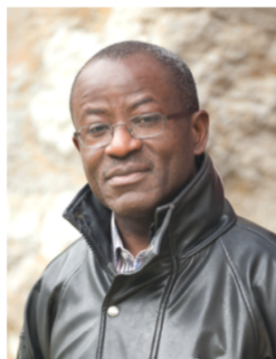
Kand. Nr. 2.11

Weil mir die Zukunft von Nidau am Herzen liegt.