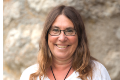
Kand. Nr. 2.05

1974 Eidg. Dipl. Produktionsleiter, Maschinenzscheiner