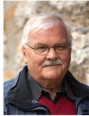
Kand. Nr. 2.10

Comme habitant de Nidau, je m'engage pour la ville.