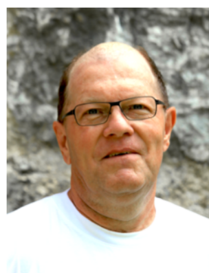
Kand. Nr. 2.14