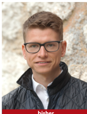
bisher Kand. Nr. 2.04

SVP - Damit in Nidau auch in Zukunft ein sicheres und selbstbestimmtes Leben möglich ist.