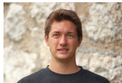
Kand. Nr. 2.03

1983 Manager-Deputy Head of Logistic Operations Goaltrainer Junioren EHC Biel Vorstand Verein „Stop AGGLOlac“ www.markus-baumann.ch