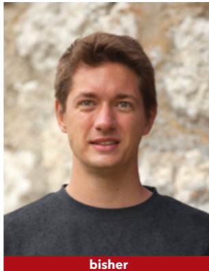
bisher Kand. Nr. 2.01