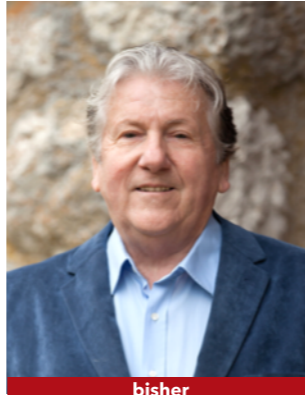
bisher Kand. Nr. 2.02

Ich möchte mich weiterhin für gesunde Stadtfinanzen und für ein vielseitiges Sportangebot am Nidauer Seeufer einsetzen.